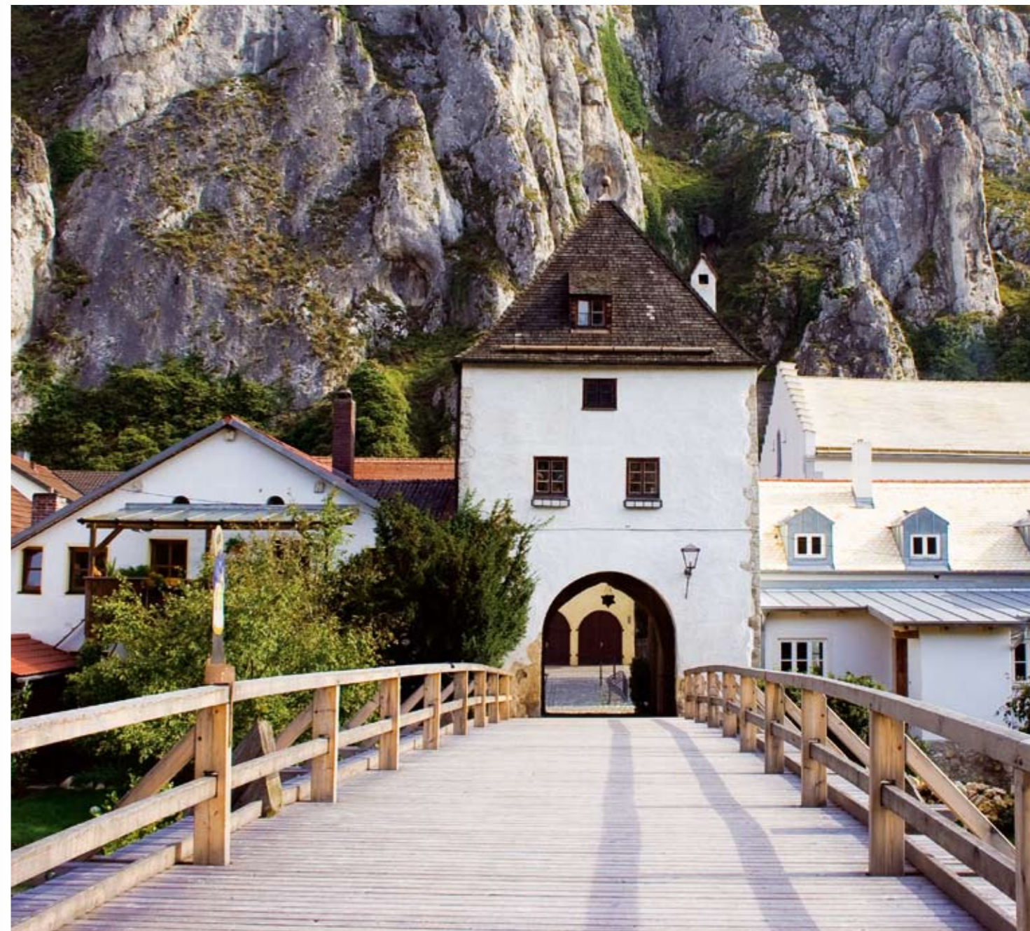
Bruck und Bruckturm im Herzen Essings, am Rathaus Essing ohne Bruck - ein Roß ohne Gschirr! Die Bruck ist da, „solang man denkt“

In den weiten Feldern der waldumschlungenen, häuserlosen Jurahochfläche hinter Randeck steht das Kirchlein St. Bartholomä, einsam. Gehört eigentlich niemand, hat wenig praktischen Zweck.